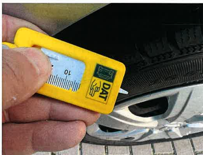
Fot. 36 IMG_8892