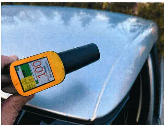
Fot. 16 IMG_8866

Biuro Poleceniawstwa Samochodowego, Ruchu Drogowego, Hygiena Maszyn i Urzadzén Int. Mirosław Kolomański 22-200 Sopot, Gdańsk 11-03-2024