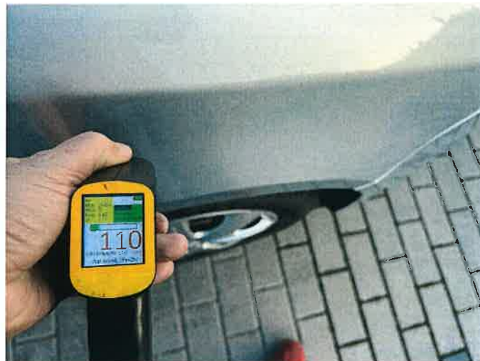
Fot. 6 IMG_8856