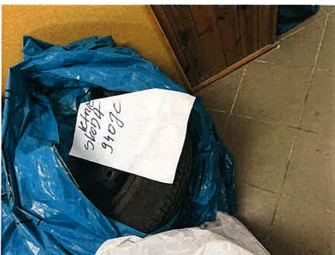
Fot. 37 IMG_8900