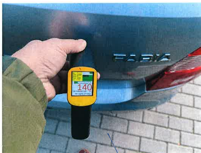
Fot. 10 IMG_8860

Biurowo Rzeczoznawstwa Samochodowego, Ruchu Drogowego, Wydany Maszyn i Urządzeń inż. Mirosław Kołomański 83-200 Starchard Gdański NIP 592 133 965