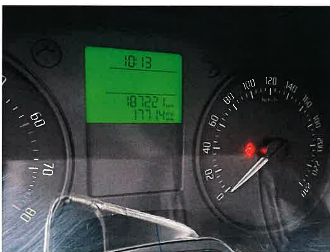
Fot. 40 IMG_9070

Biuro Fachowe i Usługi Samochodowe, Ruch Drogowy, Mycie Maszyn i Urządzeń Inż. Mirosław Kołomański 82-200 Starogard Gdański 71 333 9933