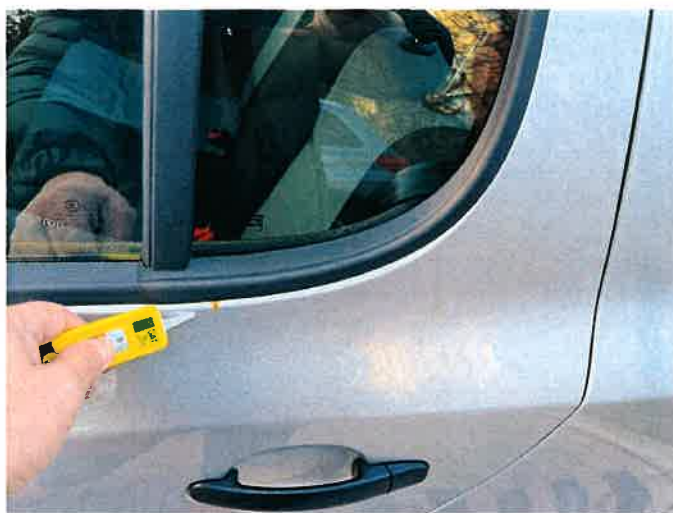
Fot. 26 IMG_8878