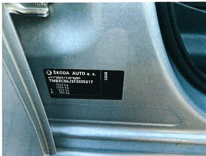
Fot. 30 IMG_8883