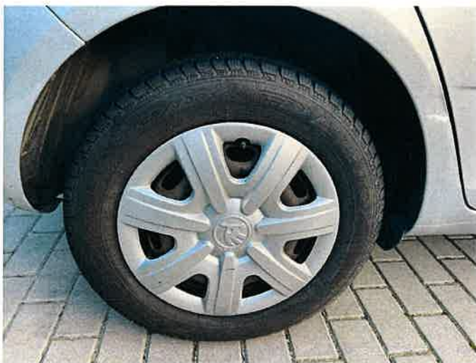
Fot. 35 IMG_8891