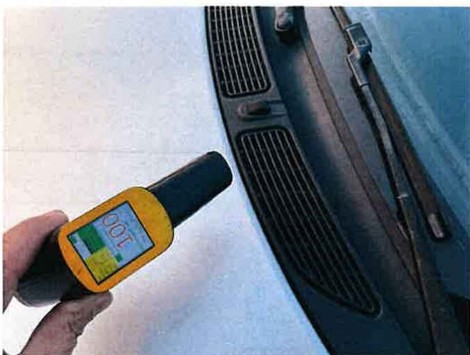
Fot. 15 IMG_8865