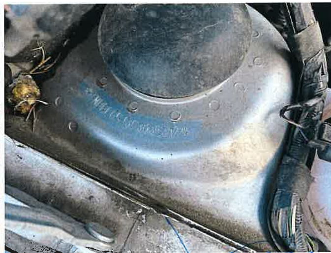
Fot. 34 IMG_8887