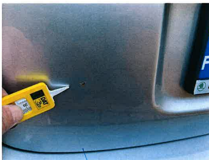
Fot. 28 IMG_8880