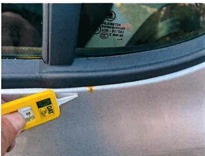
Fot. 27 IMG_8879