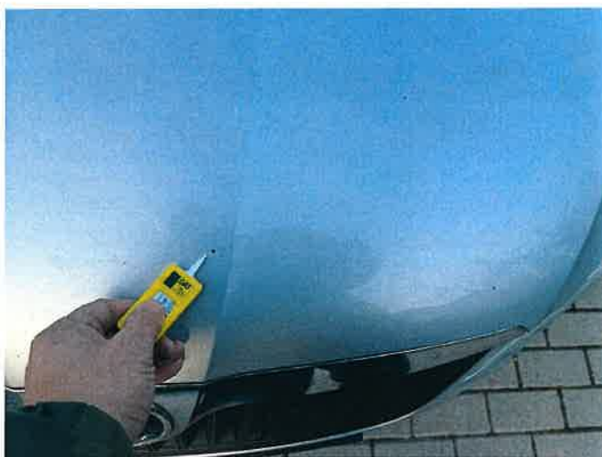
Fot. 20 IMG_8871