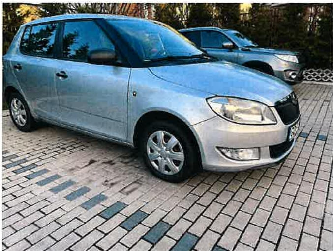
Fot. 1 IMG_8851