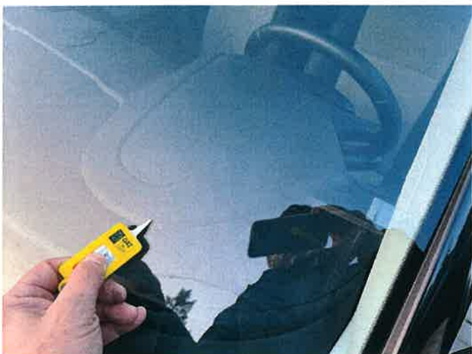
Fot. 21 IMG_8873