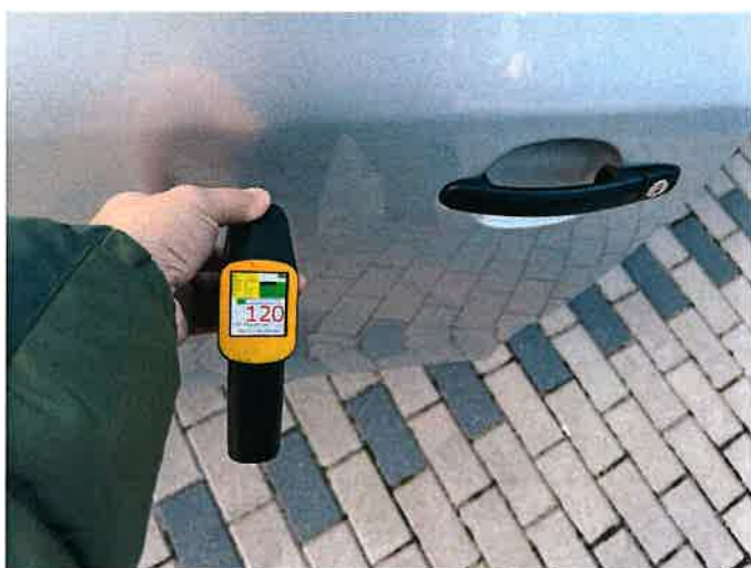
Fot. 13 IMG_8863