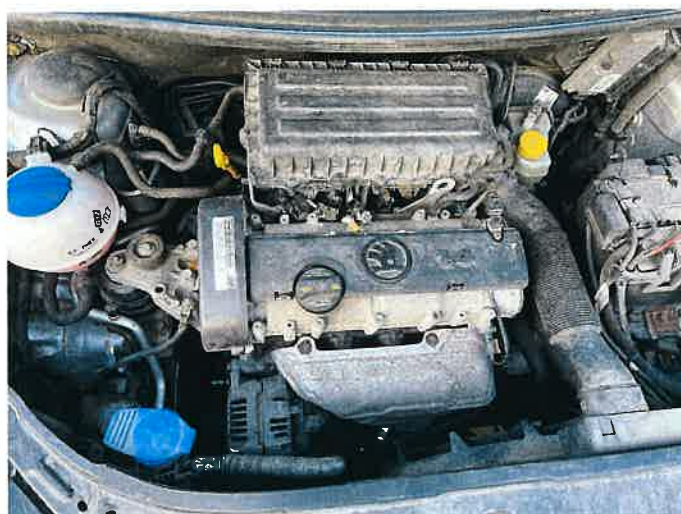
Fot. 33 IMG_8886