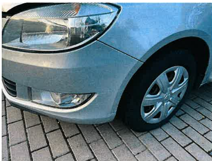
Fot. 23 IMG_8875