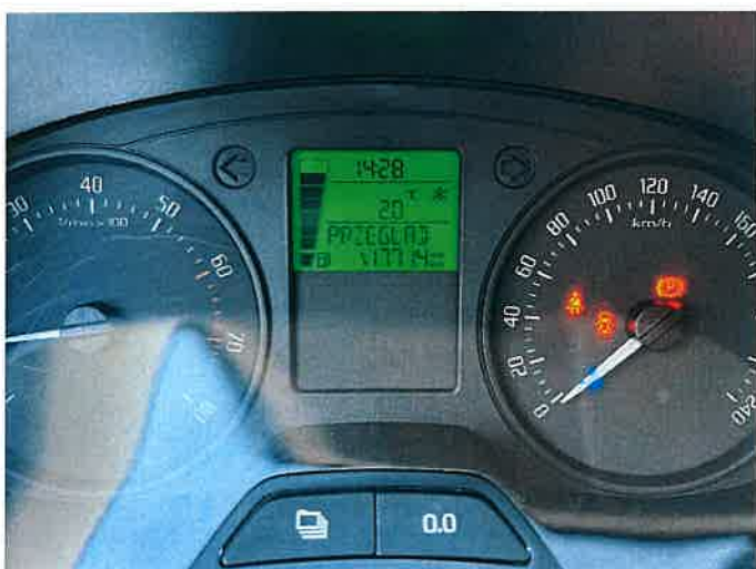
Fot. 19 IMG_8869