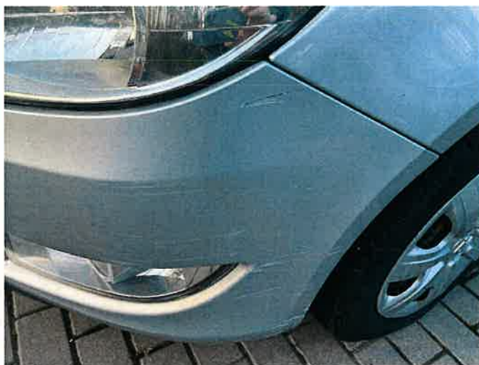
Fot. 24 IMG_8876