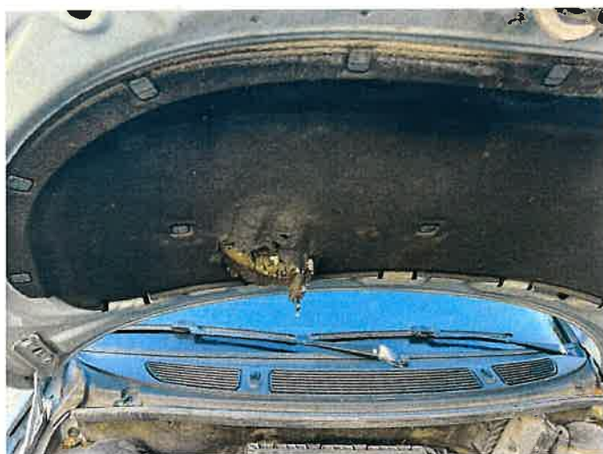
Fot. 31 IMG_8884