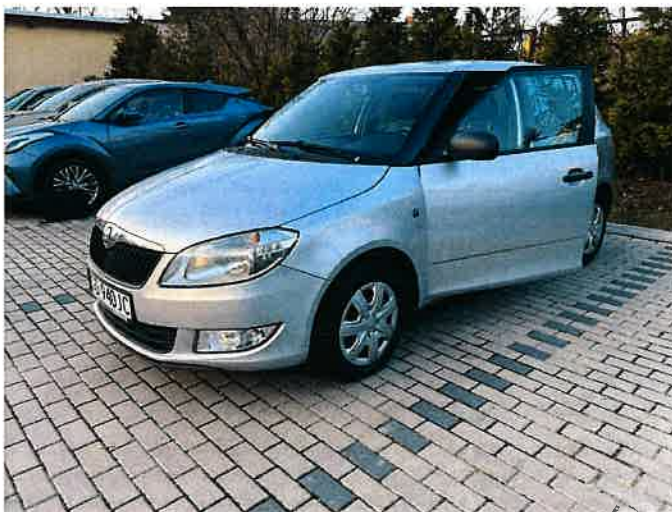
Fot. 2 IMG_8852