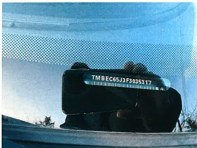
Fot. 17 IMG_8867