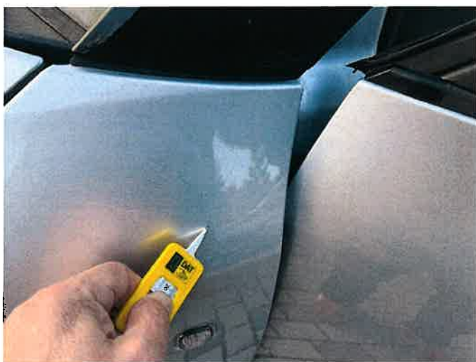
Fot. 25 IMG_8877