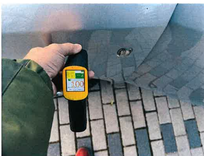
Fot. 14 IMG_8864