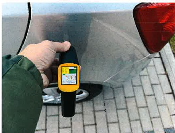
Fot. 11 IMG_8861