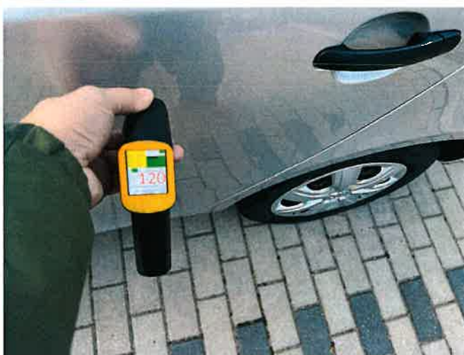
Fot. 12 IMG_8862