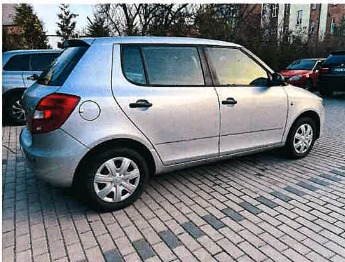
Fot. 4 IMG_8854

Biuro Techniczne: Samochodowego, Trafiku Drogowego, Wykony Maszyn i Urzadzen inż. Mirosław Kołomański 80-100, Starogard Gdański 80-100, Starogard Gdański