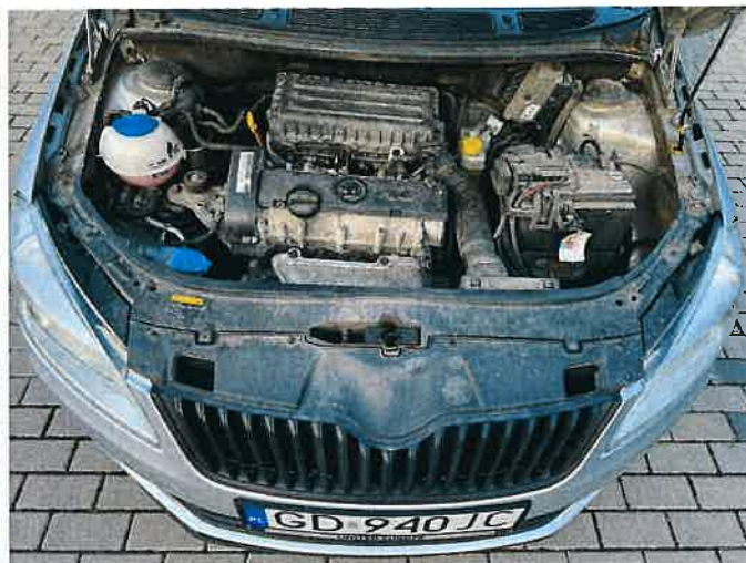
Fot. 32 IMG_8885