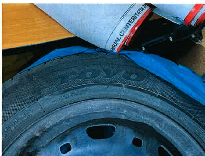
Fot. 38 IMG_8901