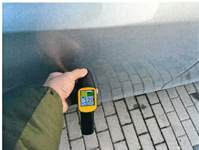
Fot. 8 IMG_8858