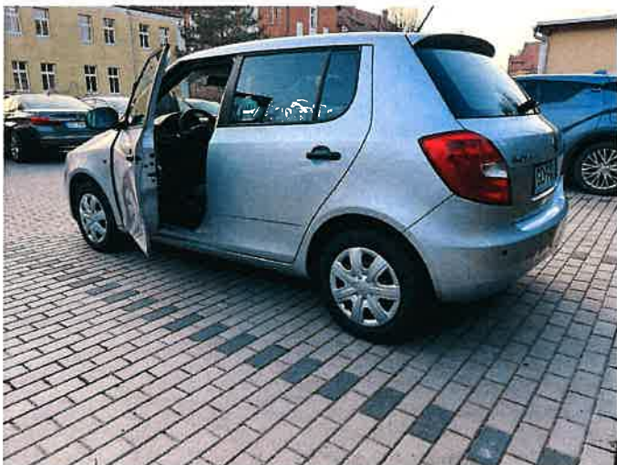
Fot. 3 IMG_8853