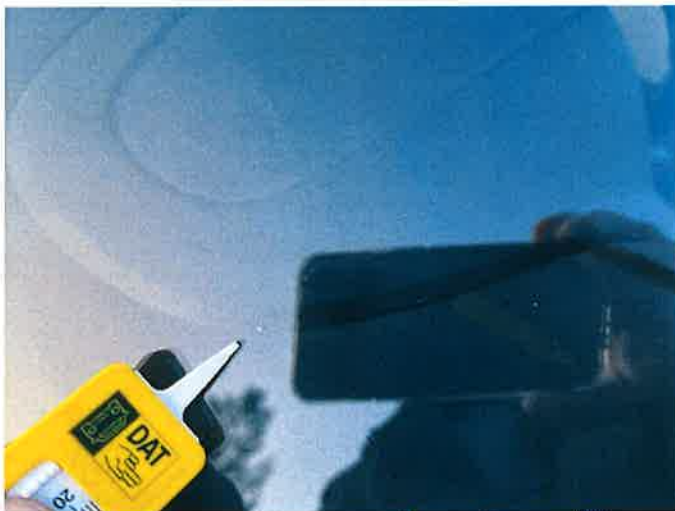
Fot. 22 IMG_8874