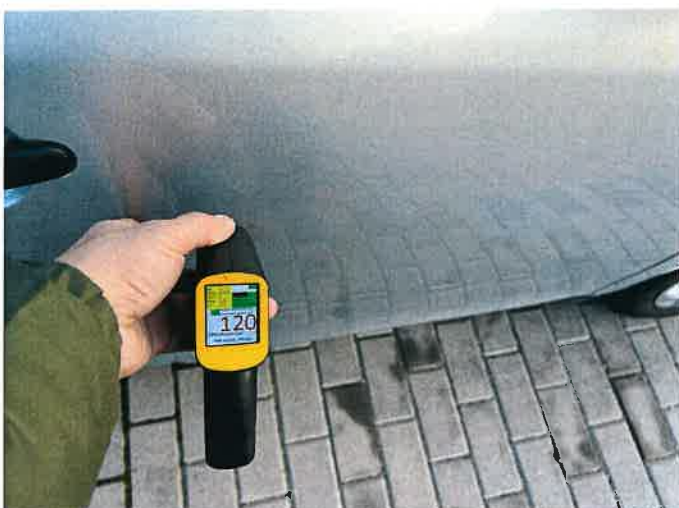
Fot. 7 IMG_8857