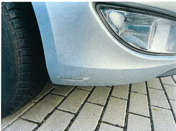
Fot. 5 IMG_8855