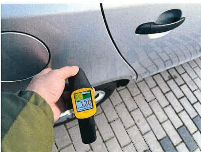
Fot. 9 IMG_8859