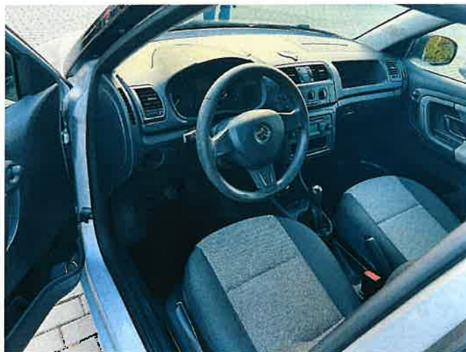
Fot. 18 IMG_8868