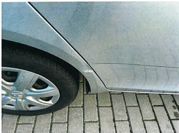
Fot. 29 IMG_8881